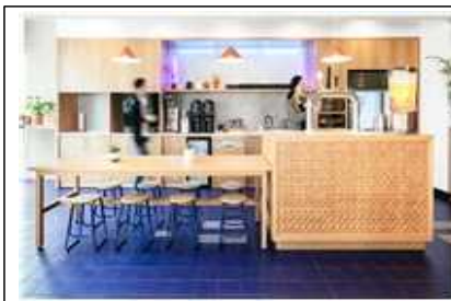
위워크 풀 서비스 팬트리