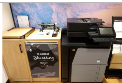
공용 프린트 스테이션