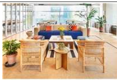
커뮤니티 라운지 및 업무공간