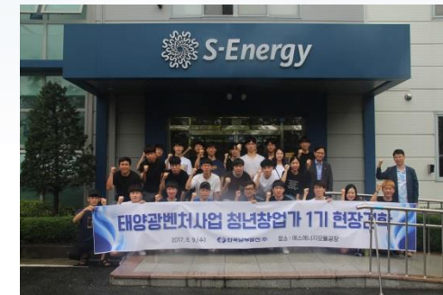
<태양광모듈공장 현장 견학>