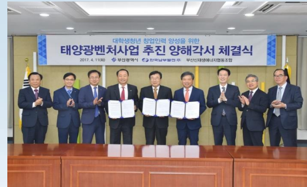
<MOU 체결(부산시, 남부발전, 부산신재생조합)>

1기 반기수료자 22명 창업장학금 (인당250만원) 지급 ('18.4~11)