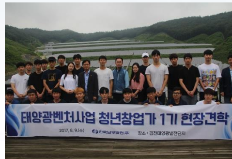
<김천태양광발전소 현장 견학>