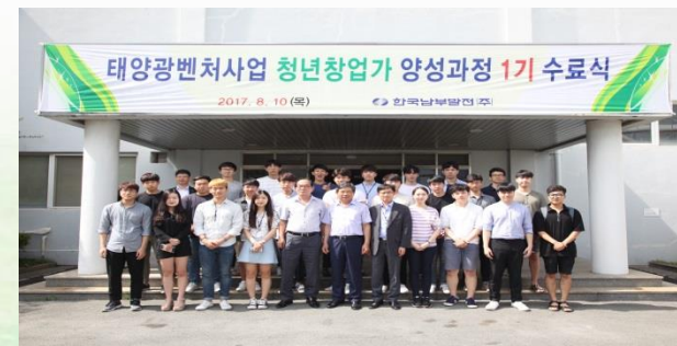
<청년창업가 양성과정 수료식>