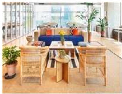
커뮤니티 라운지 및 업무공간