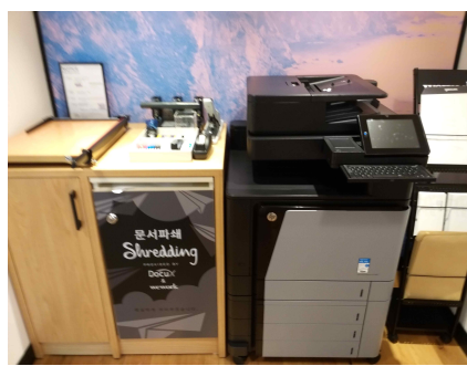
공용 프린트 스테이션