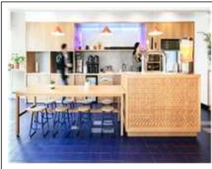
위워크 풀 서비스 팬트리